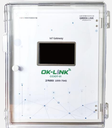
IoT Gateway (CCIOT-S-01)